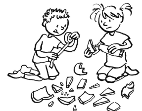
Hoe nu verder?

Nadat het water gezakt is, mogen de mensen en de dieren weer naar buiten. Het verhaal van de mensen begint opnieuw. Maar hoe moet het verder? God wijst naar de regenboog als teken van zijn belofte.